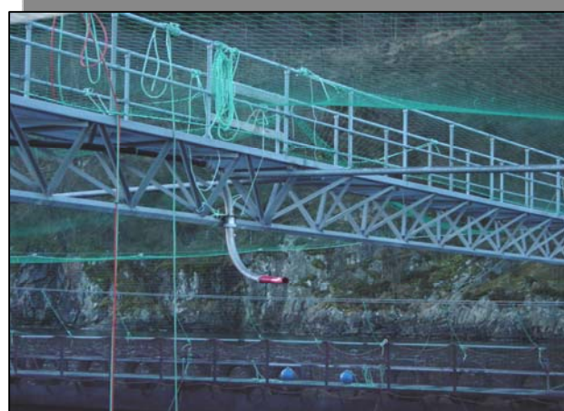
Fôrspredere med oppheng for sentralfôring